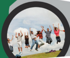
¡Actividades y más!